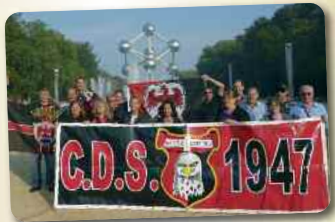
... à Bruxelles