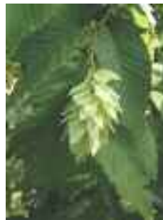
Le Charma-Houblon, Ostrya carpinifolia

L'Ostrya est un arbre assez peu connu des Niçois et pourtant très répandu dans l'ancien Comté. D'assez belle-venue, ses feuilles ressemblent à celle du Charme et ses fruits à ceux du Houblon, d'où son nom commun de "Charme-houblon". On le trouve en Ligurie, dans toute la péninsule italienne, en Grèce. Chez nous il est très abondant dans l'arrière-pays