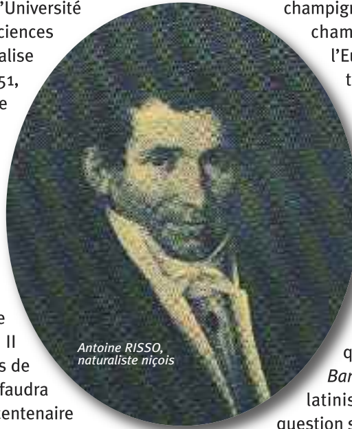
Antoine RISSO, naturaliste niçois