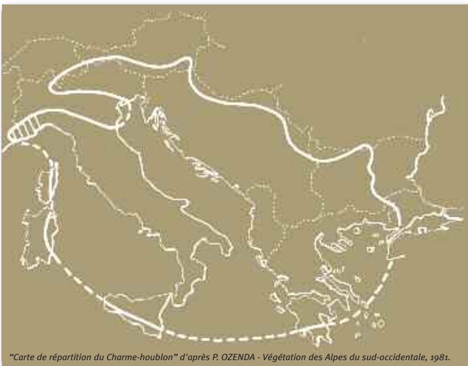
"Carte de répartition du Charme-houblon" d'après P. OZENDA - Végétation des Alpes du sud-occidentale, 1981.

Quelques années plus tard, le développement urbain nécessitera la construction d'un nouveau pont pour enjamber le Paillon. Il sera inauguré le 27 avril 1899 par la Reine VICTORIA, Reine du Royaume-Uni de la Grande Bretagne et d'Irlande, Impératrice des