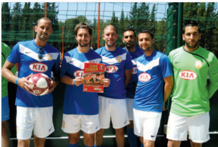
L'ÉQUIPE NIÇOISE DES "PIM PAM POU"

Lors de cette finale nationale "amateurs" de foot à 5, nous avons donc eu la chance de rencontrer l'ancien champion du Monde, Marcel DESAILLY, ainsi que le journaliste de Canal +, "l'homme à la palette", Philippe DOUCET.