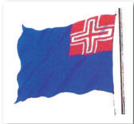
NOUVEAU DRAPEAU DES ÉTATS DE LA MAISON DE SAVOIE DE 1814 À 1848 : LE FOND EST BLEU (TRADITIONNEL POUR LA DYNASTIE), LES TROIS CROIX SUPERPOSÉES REPRÉSENTENT HABILEMENT CELLES DE SAVOIE, DE SARDAIGNE ET DE GÈNES. A NOTER QUE L'AIGLE NIÇOISE EST ABSENTE DANS CE MOTIF ORIGINAL