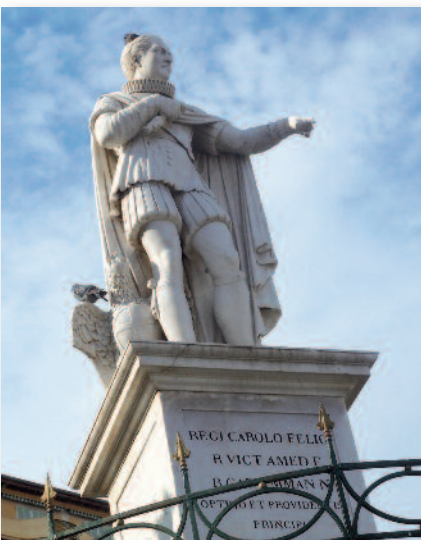
CHARLES FELIX QUE LES NIÇOIS AIMAIENT TANT ET QUI AVAIT ŒUVRÉ POUR LA CONSERVATION DU PORT FRANC ET L'ÉSSOR DE LA CITÉ, FUT BIEN MAL RÉCOMPENSÉ. EN 1851, LORS D'UNE ÉMEUTE, UN JET DE PIERRE EMPUTA LE DOIGT TENDU DU ROI

La période du "buon governo" (3) et du paternalisme de CHARLES-FELIX est heureuse pour notre cité (4) . Cet Etat des Savoie dans lequel les Niçois ont été réintégrés en 1815 n'est pas pour eux une patrie, il s'agit plutôt d'une fidélité qu'ils manifestent à une monarchie savoyarde encline à se montrer bienveillante envers le Comté ; CHARLES-FELIX (1821-1831) n'insiste-t-il pas pour que ses ministres le suivent lors de ces séjours à Nice, songeant même à en faire la capitale à la place de Turin !